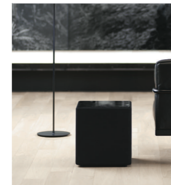
KEF maakt een reeks bijpassende subwoofers voor de R Series voor een krachtige en beheerste bas.