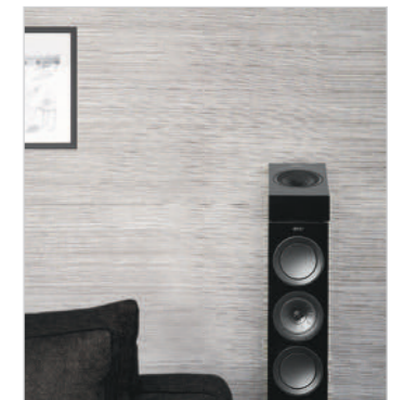
R8a bovenop luidspreker