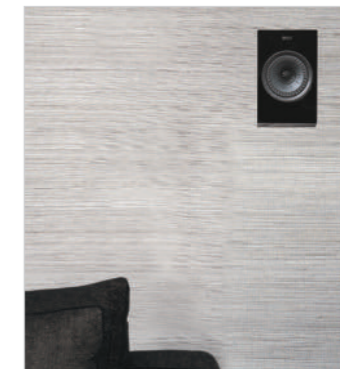
R8a aan de muur